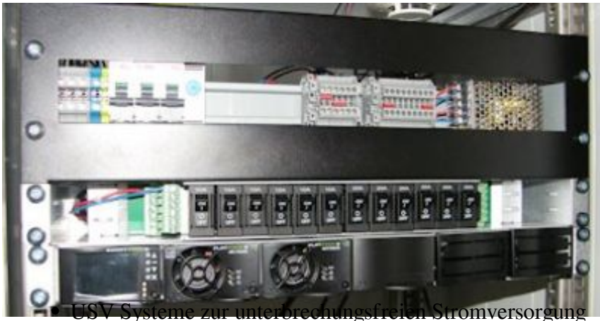
USV Systeme zur unterbrechungsfreien Stromversorgung